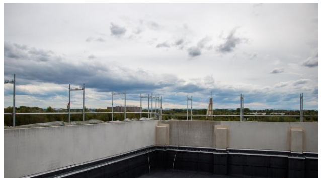
Blick vom Dach Richtung Alpen

Selbstverständlich wollten wir bei unserer Be- sichtigung auch einen Abstecher aufs Dach ma- chen. Noch fehlt die abschließende Kiesschicht, sodass sich momentan der Eindruck eines leer- stehenden Swimmingpools aufdrängt. Nur auf einer Leiter stehend ist ein weiter Blick in die Ge- gend möglich. Aber ein Platz für die zukünftige Dachterrassen-Sitzgruppe ist schon ausge- macht.