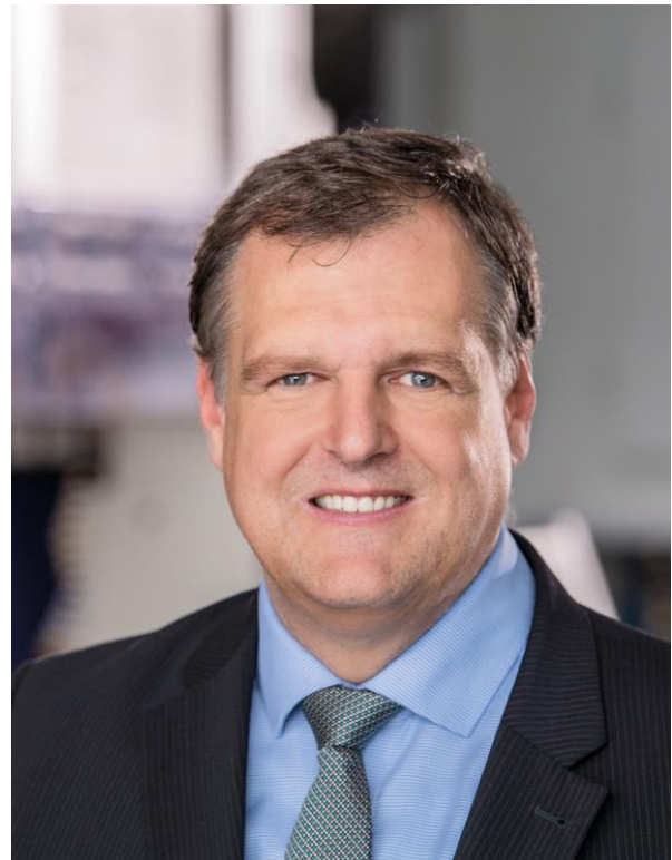
Prof. Dr.-Ing. Wolfram Volk