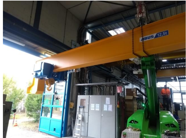
Hier war Kow-How und Fingerspitzengefühl gefordert.

gens angeliefert. In mehreren Tagen Arbeit demontierte die Mannschaft von Kran- und Förder-technik Kloiber zunächst das alte Stück, um anschließend den neuen Kran in, bedingt durch die beengten Platzverhältnisse, Millimeterarbeit einzubauen.