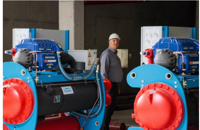
Die Klimatechnik ist ganz oben untergebracht.

In der kompletten dritten Etage, also direkt unter dem Flachdach, ist die aufwändige Haustechnik untergebracht. Eine beeindruckende Menge an Luftfilteranlagen, Wärmetauschern und derglei- chen mehr sorgt später für ein angenehmes Ar- beitsklima.