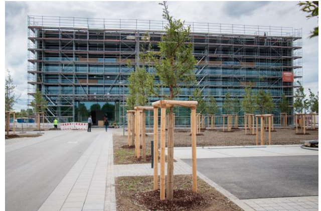
Nordansicht des Neubaus mit Haupteingang und Parkplatz

Die Grundsteinlegung ist erst gut sieben Monate her und schon ist der Rohbau bereits fertig. Zwischen der neuen TUM Elektrotechnik-Fakultät und dem Fraunhofer AISEC entsteht am Forschungscampus das neue Fraunhofer IGCV Gießereitechnikum. Von Süden auf der alten B11 kommend, sieht der Bau eher wie ein geschlossener Kubus aus. Hier blickt man direkt auf die 950 qm große Wand der Gießereihalle. Der massive Eindruck wird nur durch die hohen, schmalen Fenster gemildert.