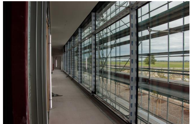
Blick aus der Büroetage durch die Glasfront nach Norden

Dagegen wird die Ansicht von Norden durch eine Vollverglasung der Gebäudefront dominiert. Es entsteht ein transparenter, luftiger Eindruck. Auch wenn uns später der Blick auf die Alpen verwehrt wird, so ist die Aussicht Richtung Freising und den Flughafen aus der 3. Etage sehenswert.