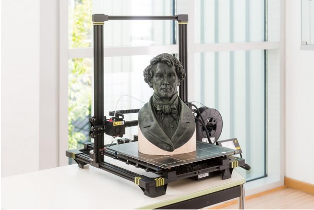
Leo von Klenze, gedruckt im FDM-Verfahren

pact Scan System fotografiert und daraus zunächst ein virtuelles Modell erstellt. Eine Replik aus dem FDM-Drucker zeigt das eindrucksvolle Ergebnis: