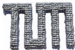
Abbildung 1: Mittels MJT additiv gefertigtes Logo der TUM aus AlSi12. Die Höhe beträgt ca. 2 cm

Im untersuchten Verfahren wird das Bauteil tropfenweise aus geschmolzenem Metall aufgebaut. Im Vergleich zu etablierten additiven Verfahren (v. a. Selektives Lasersintern und Selektives Laserschmelzen) bietet das sog. Material Jetting (MJT) potentiell Vorteile bezüglich der Baugegeschwindigkeit sowie den Halbzeug- und Anlagenkosten.