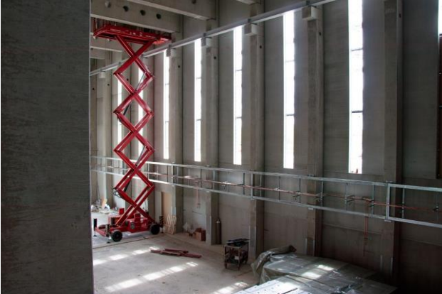
Neue Gießereihalle im Rohbau, Blick von der 2. Etage in die Halle, Foto: © sis/utg

druck eines Flugzeughangars. Ein 10 t Hallen- kran und die beiden hohen Rolltore an den Schmalseiten erleichtern später die Anlieferung von Maschinen und Material.